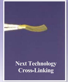
Control with no dose